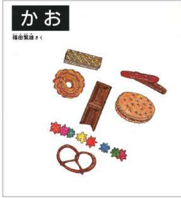
「かお」/1978年 福音館書店

巧妙にデザインされたユーモアがたっぷり詰まった絵は、情報を伝えるだけではなく見る者の心を動かし、夢中にさせてくれます。ぜひ福田氏の魅力をお楽しみください。