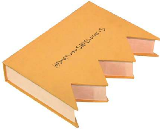
「のこぎりの歯のような人生」/1978年